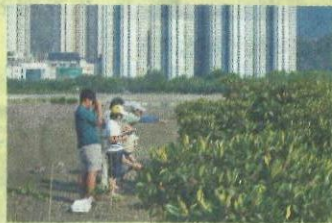
● 生態導賞團監察東涌河。