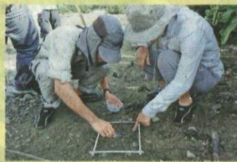
● 市民協助進行生態調查。

文：希信 查詢： www.greenpower.org.hk/tcriver/chi/plan_detail_02.shtml