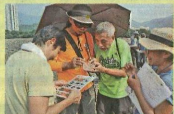
● 東涌河沿岸生物豐富，引起導賞團參與者的興趣。